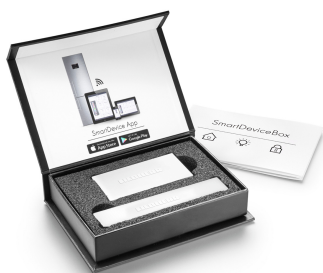
SmartDeviceBox jako dovybavení

DuoCooling díky dvěma zcela odděleným chladicím okruhům zajišťuje, že nedochází k žádné výměně vzduchu mezi chladicím a mrazicím oddílem. Potraviny se tak nevysušují, ani se nepřenáší žádný zápach. A to znamená: méně vyhazovat, méně nakupovat, ale více ušetřit a užívat si.